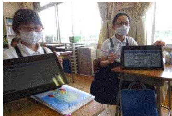
↑友達同士で教え合っています