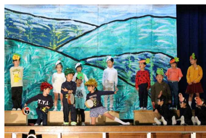
【1年: はたけのしたは おおさわぎ】