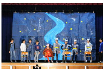
【5年: 心がひとつになるとき】