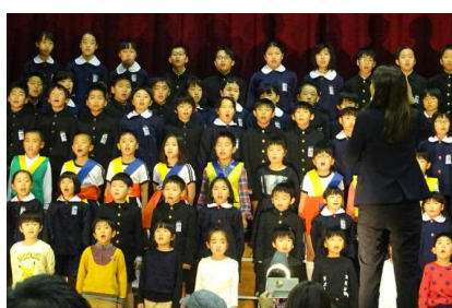
【全校合唱: 世界中の こどもたちが】