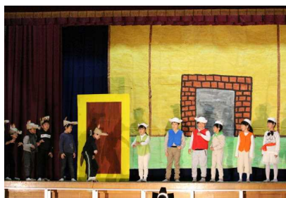
【2年: おおかみと 七ひきの子やぎ】