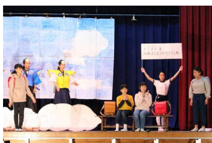
【6年: 雲の上の三武将】