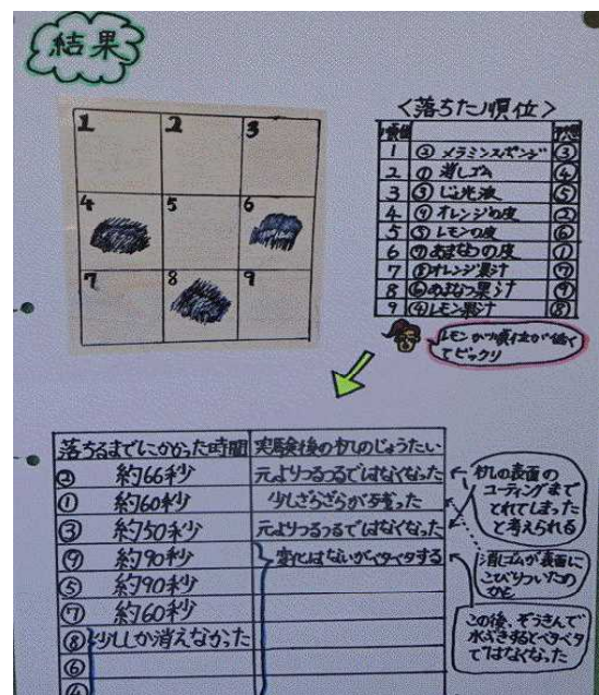
「油性のペンの落とし方」より

他学年にも興味深い夏休みの成果がたくさんあると思いますので、保護者の皆様、参観日を楽しみにしてください。