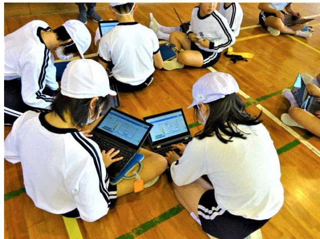
【6年生・体育・フラッグフットボール】

保護者の皆様、ご多忙の中、本校の参観日にご参加頂き有難うございました。また、同日に開催させて頂きました、次年度のPTA評議員選出、学校保健委員会につきましても、お世話になりました。引き続き、鴨方西小学校の学校運営にご協力、ご支援のほど、よろしくお願い致します。