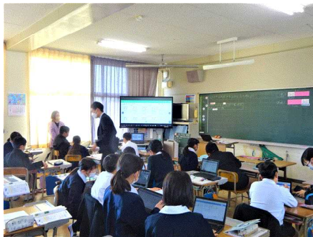
【5年生：算数・割合・30%引きの代金を求める方法を考えよう】

6年生は、体育「フラッグフットボール」でした。フラッグフットボールとは、アメリカンフットボールで行われる「タックル」に代わり、プレイヤーの腰の左右につけた「フラッグ」を取ることに置き換え、より安全かつ幅広い層が参加出来ることを目指したフットボールです。さすがの6年生は、走る力、ボールを投げる力、俊敏性など、大人顔負けの力強さです。また、終わった後の振り返りをクロームブックで入力する様子からは、完全にクロームブックを文房具として活用していることがうかがわれました。