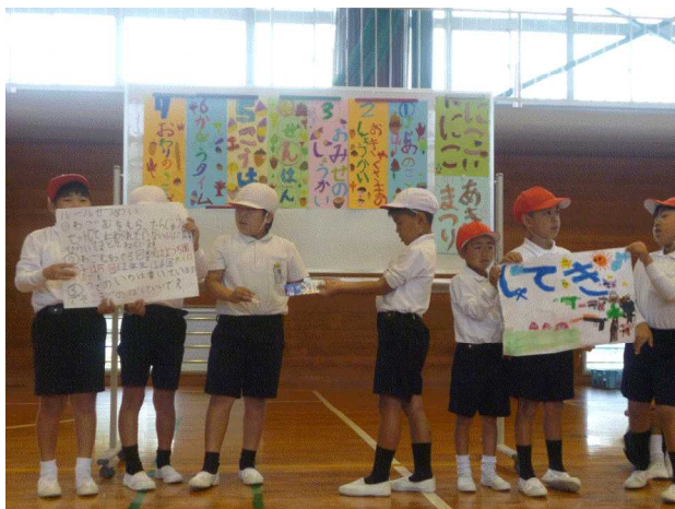
【児童による秋祭りのルール説明】

小学校の中では、高学年にお世話をしてもらう側の1・2年生が、園児の前では、立派なお兄さんお姉さんになっているのが、不思議です。子どもも大人と同じで、場と役割を与え、動機付けするのが成長に向けて必要なことだと再認識しました。