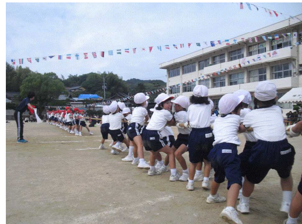
【150年の絆を引っ張れ!全校綱引き】