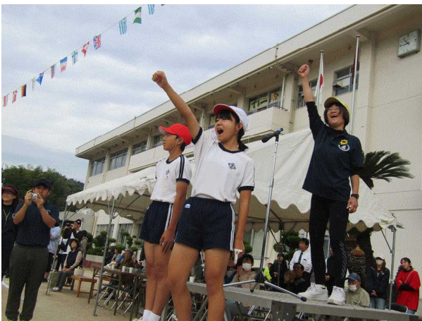
【開会式の様子：応援団長による鼓舞】

鴨西の子どもたちは、体育の時間や朝の時間、中休みを使って、運動会の競技や演技の準備を入念に進めてきました。当日は、練習してきた自分を信じて、仲間を信じて、今持てる力を出し切りました。また、自分たちが頑張るだけでなく、見に来てくださったお客様を巻き込んで、楽しんでもらえるような工夫を取り入れました。皆様、楽しんでいただけましたでしょうか。