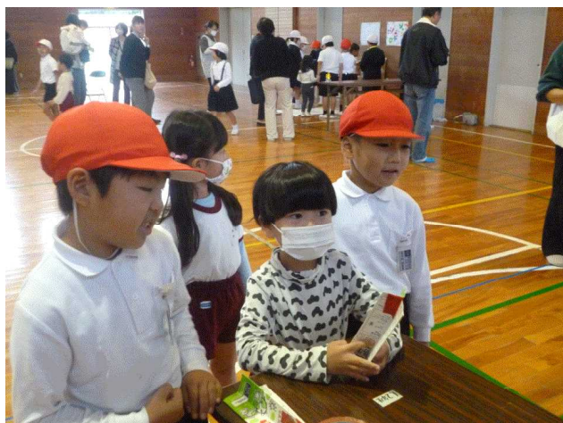
【園児に優しく遊び方を教える児童②】