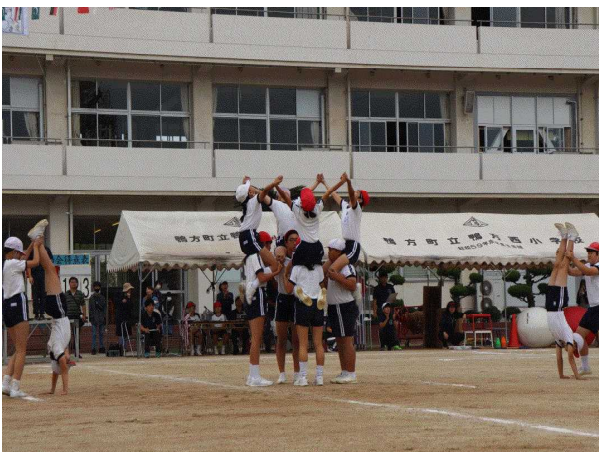
【5・6年生：努力の結晶(組体操)】