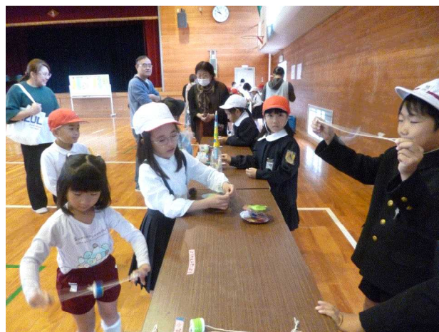
【園児に優しく遊び方を教える児童①】