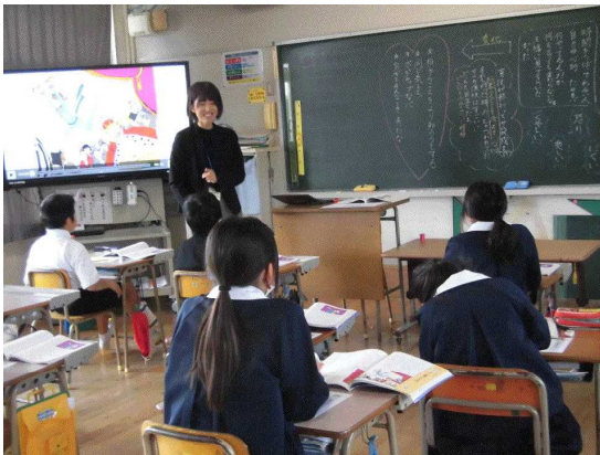
【5年：ブランコ乗りとピエロ】