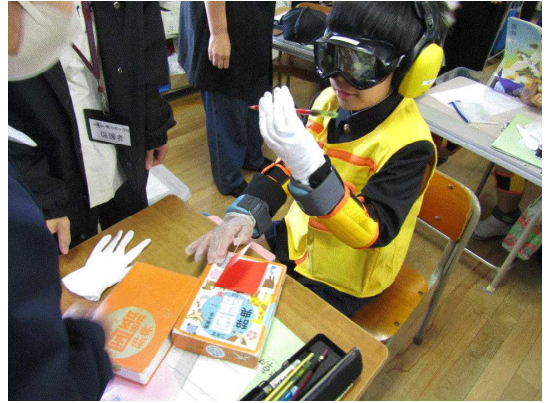
【4年：だれもが幸せな町をつくろう】