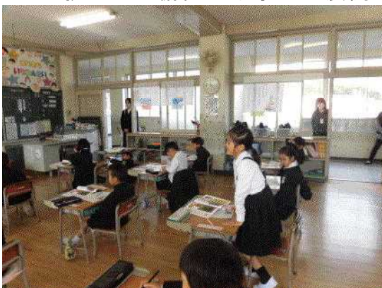
【1年：かぼちゃのつる】

11月19日は人権参観日でした。道徳や学活を中心に、授業をご覧いただきました。どの教室でも協働的な学びが展開されていました。