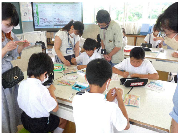
【5年生：ソーイング はじめの一歩】