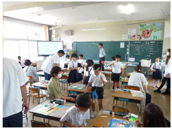
【2年生：みんなでワイワイ 紙けん玉】