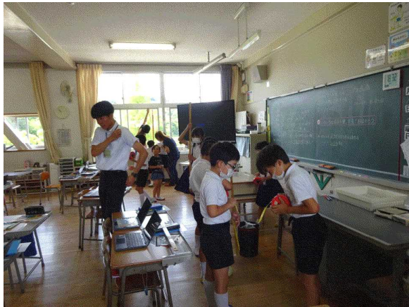
【3年生：長い長さをはかって表そう】