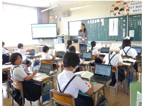
【4年生：つなぎことばの働きを知ろう】